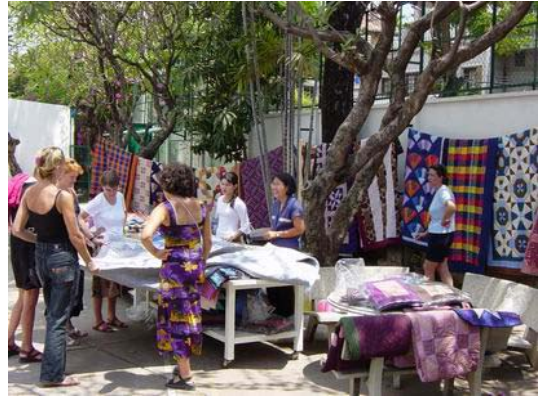
Vente à l'école française