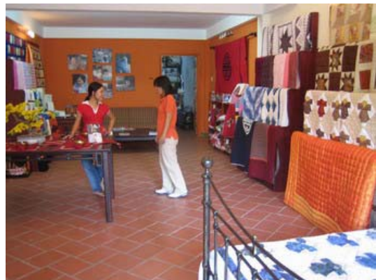
La nouvelle boutique !