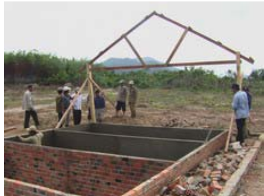
Construction des fosses

Autre tracasseries : notre partenaire à Dúc Linh qui participait à la récolte des sacs en plastique auprès des écoles, qui en faisait le tri pour les revendre, a disparu avec plus de 4 tonnes de déchets. Nous dépensons une fois encore une énergie considérable avec les autorités et la police pour régler cette triste affaire.