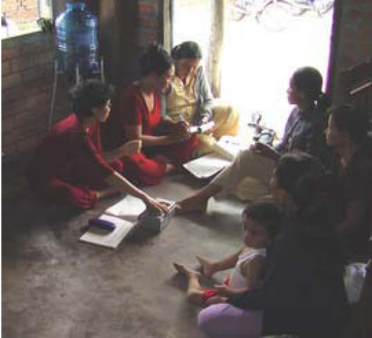
A Donh Hà, de nombreux groupes épargne-crédit fonctionnent à merveille

les biens d'une emprunteuse malhonnête ont été saisis et les autorités ont donné la priorité aux créances de Thiên Chí (c'est la règle au Vietnam : priorité aux fonds d'origine étrangère). Thiên Chí exige un remboursement immédiat de la part des gens qui ont manifestement les moyens de payer ; pour les ménages en difficulté, des délais sont accordés, et en cas de situation économique très difficile, la dette peut être effacée.