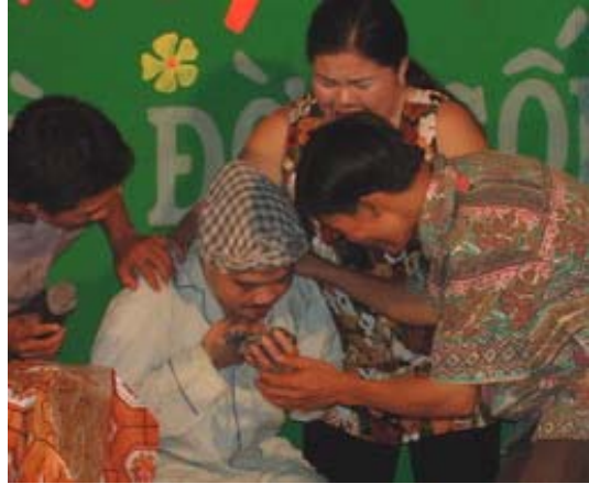
Spectacle pour la journée anti-tabac

L'équipe Croquemitaine 2 est venue pour la 2 ème fois, au programme : mise sur pied d'un spectacle avec 7 acteurs choisis dans les 3 troupes. Le spectacle sera présenté en Belgique, en France et au Luxembourg entre 28 septembre et la mi-novembre. Thème : les trafics d'êtres humains, problème croissant dans la région. Une formation fabuleuse, 14 journées intenses. Et l'excitation pour ces paysans très modestes de faire un voyage inespéré.