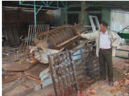
Un filtre rotatif adapté à partir d'une batteuse de riz