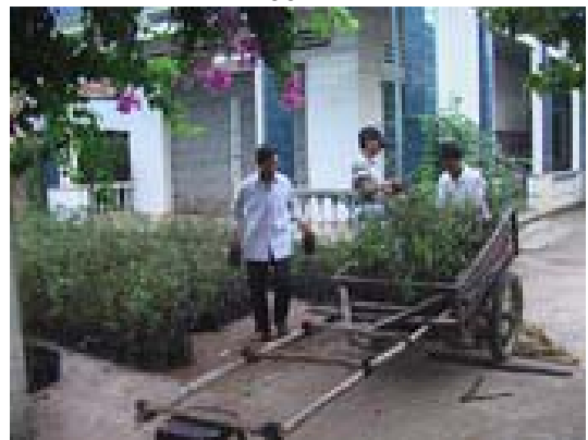
Replanter. Ce sont des arbres de valeur. Avant qu'ils ne soient distribués aux paysans une partie a été volée dans la nuit, du bureau de Thiên Chí

La directrice de Terre d'Oc a visité Thiên Chí en juin et les accords ont été consolidés. Elle était accompagnée d'un photographe car leur site Internet va présenter le projet et l'origine des produits. Chaque emballage fait déjà mention de notre site Internet, il contiendra bientôt une petite brochure en plus.