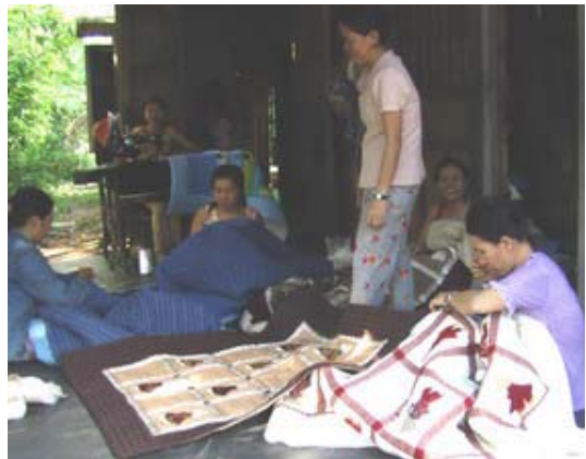
Thu, chef de groupe, est débordée par le nombre de femmes qui veulent rejoindre son groupe.