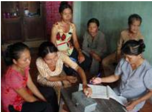
Un groupe épargne-crédit

Ces visites, organisées de manière professionnelle et efficace, m'ont permis de