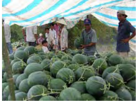
Bonne récolte de pastèques !

Les derniers mois ont été tendus pour les paysans qui produisent des noix de cajou : les prix ont fluctué dans de grandes proportions, de 0,1 à 0,7 euro. Les acheteurs ont été nombreux à faire faillite, après avoir fait de petits stocks au mauvais moment. Un petit atelier employant 50 personnes vend et achète en effet pour plusieurs milliers d'euros chaque jour. Depuis plusieurs années nous nous intéressons à la question car si le Vietnam exporte à 3-5$/kilo, le consommateur paie souvent plus de 20 euros. Thiên Chí a sondé les paysans pour mettre sur pied une coopérative qui permettrait, via les réseaux de commerce équitable, d'avoir un meilleur prix. Ils sont si enthousiastes qu'une centaine a tenu à verser une cotisation immédiatement. Une procédure de certification avec FLO 2 est envisagée, et c'est un long processus. Cela suppose notamment d'avoir une coopérative expérimentée. Dilemme : les paysans ne sont pas désireux de participer à une coopérative sans savoir à quoi ils s'engagent 3 , mais sans coopérative, pas d'accès à la certification FLO. Par contre ALTERECO envisage d'importer une douzaine de tonnes qui seraient achetées par Thiên Chí aux paysans, ce qui permettrait de lancer la coopérative. D'autres contacts sont en cours avec de grandes marques de la distribution.