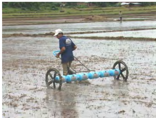
Les paysans sont très demandeurs pour ce semoir, encore peu connu : réduction des semences de 30% et augmentation des rendements.

Nous avons actuellement 1480 membres dans les groupements. La fréquentation des réunions tend parfois à diminuer pour les groupements de plus de 2-3 années, ce qui est compréhensible. L'équipe peut donc répondre à la demande de création de nouveaux groupements pour remplacer les anciens. A Dúc Linh, où Thiên Chí travaille depuis plus de 5 ans on peut envisager une réduction de notre apport, et se concentrer sur les paysans très pauvres , soit en transférant un des 2 agronomes vers un nouveau district.