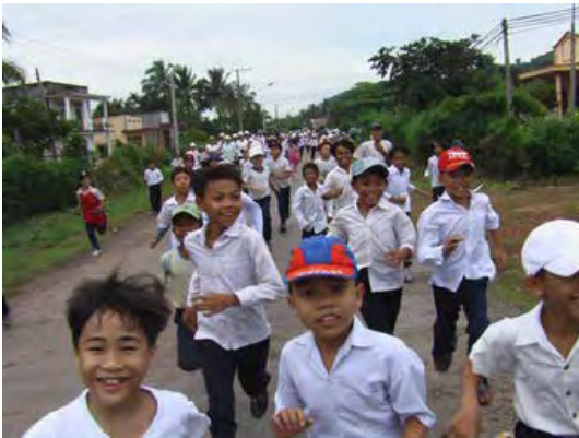
Le temps fort de la rentrée : 42000 solidaires pour que les plus pauvres soient aidés

Résumé de la situation : l'équipe locale a mis sur pied une organisation vietnamienne : Thiên Chí . Un par un, elle reprend nos programmes et devient partenaire autonome.