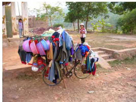
Un petit commerce ambulat

A Dúc Linh les remboursements continuent bon train, et la commune de Nam Chính reprend les choses en main. Malheureusement à Tân Hà le comité populaire semble se désintéresser du programme. Dans 8 autres communes le programme apure progressivement les anciens emprunts, plusieurs ayant d'ailleurs décidé de reprendre la gestion, par le biais de l'Union des Femmes (UDF). A Trà Tân c'est chose faite : les remboursements sont ponctuels mais la participation aux réunions est faible. La majorité des communes de Tánh Linh ont fini de rembourser tous les prêts ; dans aucune l'UDF ne reprendra le programme, tant le crédit bancaire y est devenu facile. A Long Mỹ l'UDF gère le programme avec succès, le nombre de membres augmente, elle demande à doubler le programme en volume financier et sur tout le district, mais nous n'avons pas les fonds nécessaires pour accepter.