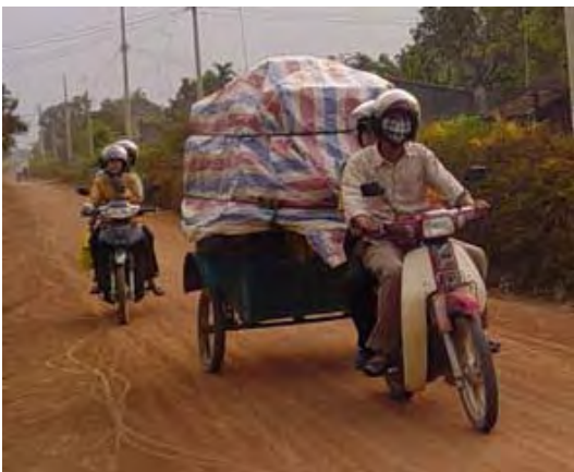
En route, chaque soir ! Dans la remorque il y a aussi une petite bibliothèque pour occuper les enfants qui attendent le spectacle.

Ainsi les spectacles ont souvent tendance à cumuler trop de problèmes au sein d'une même famille : alcoolisme, vols, jeux, drogues, accident de la route etc. Par conséquent l'impact est réduit, personne ne pouvant imaginer être un jour dans une situation aussi abracadabrante ! Enfin, souvent les personnages sont manichéens : soit parfaits, soit des monstres. Là aussi, l'impact est réduit, car pas d'hésitation possible ! Mais convaincre des artistes est chose ardue ! Une évaluation type, et simple, des spectacles est décidée, nous prendrons un échantillon chaque mois. Et les troupes devront en tenir compte.