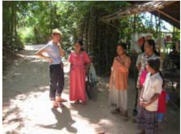
Un village soutenu par Rade et Mékong Plus: 300 enfants en âge d'école secondaire, 13 inscrits.

Pour la première fois ce bulletin rendra compte de notre nouveau partenaire : RADE, au Cambodge, pas loin de la frontière vietnamienne.