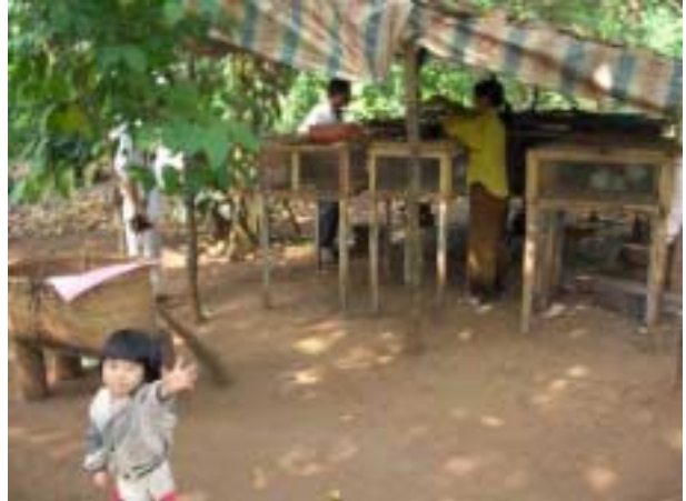
Un petit prêt sans intérêt pour aider une famille très pauvre : 25 euros pour son élevage de lapins. Ça marche, elle vient de démarrer son 2 ème cycle.

Le programme vise maintenant davantage les ménages de la grande pauvreté, le millier de bénéficiaires de bourses scolaires. Il faut consentir un suivi intensif, des prêts sans intérêts, accepter un taux d'échec et renouveler l'aide. Mais dans l'ensemble cette approche est un succès. L'équipe a décidé d'être plus proactive et de visiter systématiquement ces familles pour leur proposer des solutions : le petit élevage est souvent la seule option car elles n'ont souvent plus de terres 14 .