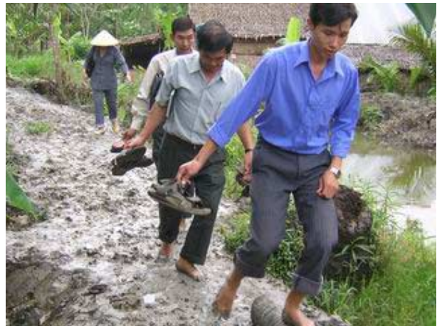
Les chemins de Xa Phiên, commune pauvre de Long My, pendant la mousson.

A Long Mỹ dans les villages les plus pauvres les chemins sont boueux en mousson, rendant tout mouvement difficile. Les ponts appelés « ponts de singe » sont dangereux surtout pour les femmes et enfants. La vente des récoltes est plus coûteuse. Beaucoup de canaux n'ont pas de canalisation, l'eau est stagnante et très polluée. La 1 ère demande de la population et des autorités a été d'améliorer cette petite infrastructure. En décembre 2003 mètres ont été réalisés, Mékong Plus contribuant pour 25% du coût, le reste étant à charge de la population et des autorités. 2300 journées de travail ont ainsi été créées.