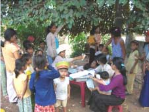
Dans le village Cham à Tân Linh

des groupes ne se réunissent plus qu'une fois par mois au lieu d'une fois par semaine. Les réunions des chefs de groupe rassemblent la moitié des personnes invitées. Et surtout les coordinatrices villageoises sont tellement sollicitées par la banque, les compagnies d'assurance, qui les paient 6 fois plus que le permettent les intérêts du programme épargne-crédit 4 , qu'elles sont souvent moins motivées à suivre les groupes de femmes.