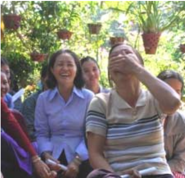
Chefs de groupe en réunion !

avantage de promouvoir l'épargne et l'entraide, mais les femmes sont moins motivées qu'avant pour cela 8 .