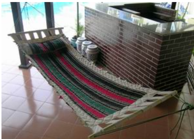
Le dernier succ s. 3 jours de travail, vendu 33$.