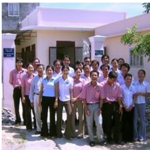
L'équipe inaugure le bureau de TC