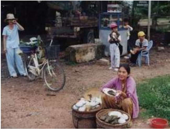
Les petits commerçants empruntent souvent à 240%/an

Le programme reste pertinent, même si le nombre de membres va sans doute connaître un tassement : l'équipe va accorder les prêts plus sévèrement pour éviter de perdre du temps avec la minorité qui ne rembourse pas bien. Bien entendu, la baisse du taux d'intérêt va rendre la viabilité financière problématique : une expérience est menée avec la commune de Dúc Chính, qui gère directement le programme, rémunérée par les intérêts, et couvrant la majeure partie des coûts, qui sont bien moindres qu'avec Viêt Nam Plus. Il faut attendre 3-6 mois pour mesurer la viabilité de cette alternative.