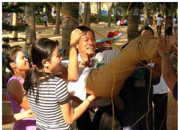
Jeux concours, lors du WE de bilan : partenaires, officiels et l'équipe Viêt Nam Plus se sont déchaînés dans la joie.

Il semble décidément quasi impossible de créer une ONG locale, aussi l'équipe a-t-elle plutôt opté pour une société privée. Elle aurait pour principal objet social les activités de développement, des activités lucratives pourraient servir à générer des fonds; les bénéfices seraient statutairement tous affectés aux activités de développement. Le comité exécutif actuel (6 seniors) ferait partie des administrateurs mais n'auraient pas plus de 35% des parts et ne pourraient prendre aucune décision sans au moins 2 des 3 administrateurs extérieurs –qui sont par ailleurs fort