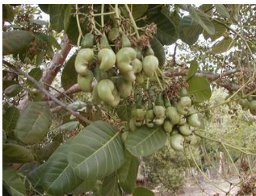
La noix de cajou sur son arbre, l'anacardier