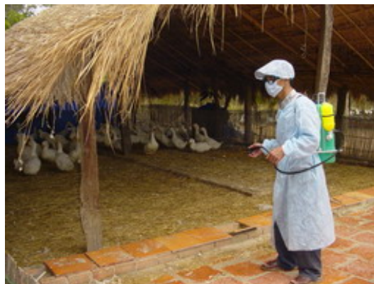
Un programme de prévention contre la grippe a été mis en place

La grippe aviaire n'a apparemment tué aucun animal dans la région, seuls quelques gros élevages ont spontanément demandé aux autorités d'incinérer leur cheptel. L'impact a été surtout économique : chute des prix à cause de l'interdiction des transports, les paysans ont été pris à la gorge et ont cessé de nourrir la volaille, les élevages ont été décimés. Viêt Nam Plus a démarré un programme pour les familles les plus pauvres : prêts et conseils techniques pour les aider à re-démarrer.