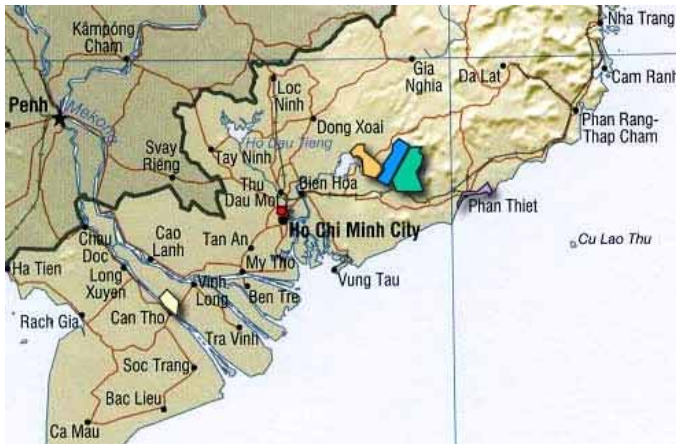
Dúc Linh est colorié en bleu : la région de production

Viêt Nam Plus connaît bien les conditions des campagnes : nous y menons des programmes de développement depuis plus de 10 ans, et 3 équipes y vivent en permanence. L'économie du pays se développe vite, mais il y a quand même des laissés pour compte, et l'écart avec la ville se creuse : les paysans avec qui nous travaillons ont un revenu de 1-2 euros/jour par famille -15 fois moins qu'à Hô Chí Minh Ville !