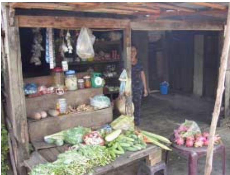
Les petites marchandes ont rarement accès à la banque

L'équipe locale de Viêt Nam Plus a entamé une réflexion de fond, sur ce programme :