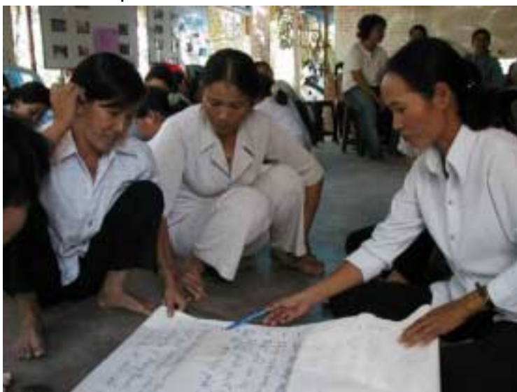
Les coordinatrices villageoises en réunion : aborder franchement les problèmes et trouver des solutions ensemble