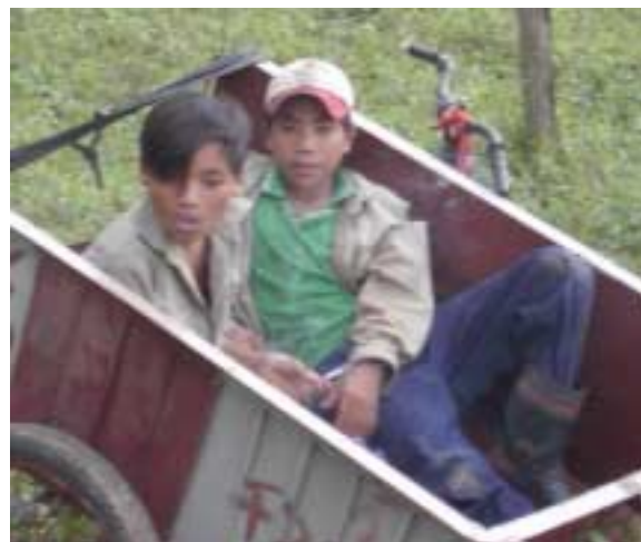
Les jeunes fument beaucoup et plus tôt