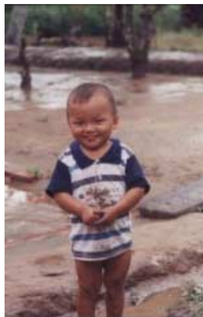
Un futur client de la banque !