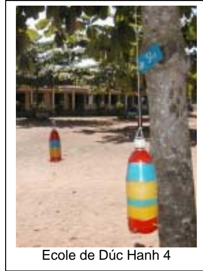
Ecole de Dúc Hanh 4

Une visite a été organisée à Vinh Long, province identifiée par l'AOI comme étant particulièrement dynamique pour l'éducation. Les enseignants sont revenus enthousiastes et plein d'idées, notamment ces bouteilles qui pendent aux arbres dans la cour : il y a des livres à l'intérieur ! Des bancs ont été livrés aux écoles pour encourager la lecture entre les classes. Des hauts-parleurs ont aussi été donnés, pour faciliter l'organisation des activités scolaires.