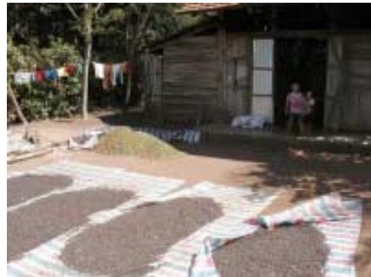
A Dúc Linh : séchage du café en décembre

Considérant la décevante performance dans le district de Bình Minh, nous avons été voir à côté, à Châu Thành. Les discussions ont été fructueuses, une quinzaine de cadres communaux et de district sont venus visiter Dúc Linh pendant 2 jours, un programme a été conçu et proposé pour signature à la province. Un démarrage sur 4 communes pourrait avoir lieu après le Têt (mars).