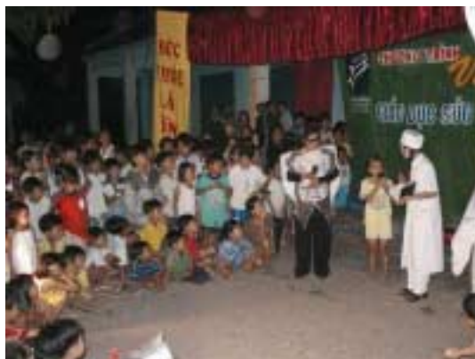
Le théâtre sur l'hygiène dentaire passionne les enfants

Résumé du programme : Viêt Nam Plus donne énormément de formations, et celles-ci doivent parfois être ludiques et toucher aussi le plus grand nombre. 2 troupes de théâtre ont déjà été mises sur pied, et produisent 3-4 spectacles par semaine. Une troupe est devenue autonome et joue de temps en temps dans sa région. L'autre est payée par le programme. C'est un théâtre éducatif, et qui incite le public à participer, à monter sur la scène ! Les thèmes sont : l'importance de l'hygiène, l'alcoolisme, le SIDA... Chaque soir il y a en moyenne 300 spectateurs.