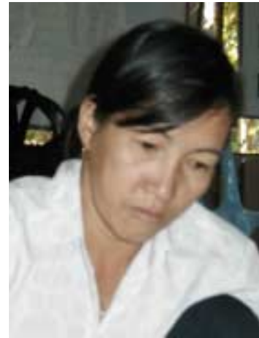
Du aide toutes les autres coordinatrices villageoises et fait l'interface avec l'UdF de Duc Linh

Auparavant les remboursements en retard (5-10% environ) n'étaient pas pénalisés, ce qui revenait à un intérêt plus bas pour ceux qui payaient en retard –les intérêts étant calculés sur une période de remboursement théorique 4 ! Désormais les contrats d'emprunts comportent une clause que les retards seront soumis à un intérêt de 1%/semaine sur le solde 5 . Il faudra sans doute un an pour mesurer l'effet de ce changement.