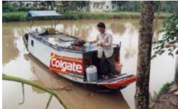
Marchand « ambulant » à Bình Minh