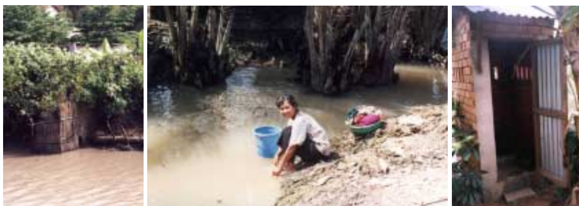
Latrines sur l'eau, pas loin de la lessive et de la vaisselle. Et de nouvelles latrines !

Pas encore de prêts sur Bình Minh, la règle étant que les femmes doivent avoir dépassé la moitié du 1 er cycle de crédit (environ 6 mois de participation au programme).