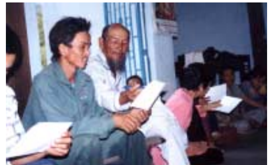
Sondage des participants

Le programme de formation de coordinateurs agricoles (plusieurs par communes, 30 au total) démarre en avril. Ils seront des relais, et permettront sans doute de pérenniser les programmes. Le Bureau d'Extension Agricole participe, mais plus à Tân Linh qu'à Đức Linh. Sur Đức Linh le cadre s'estime bien assez