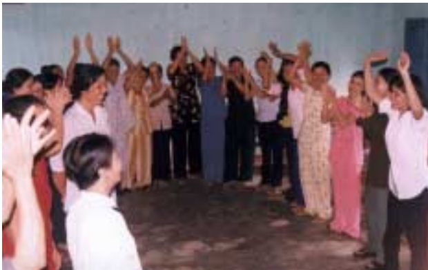
Formation des coordinatrices villageoises

Un certain nombre d'interviews ont été faites déjà dans le cadre de l'évaluation (en cours), et il apparaît que beaucoup d'officiels pensent que le projet va être terminé en 2004, comme le prévoit le contrat. Il est évident que les autorités sont impatientes de recevoir le