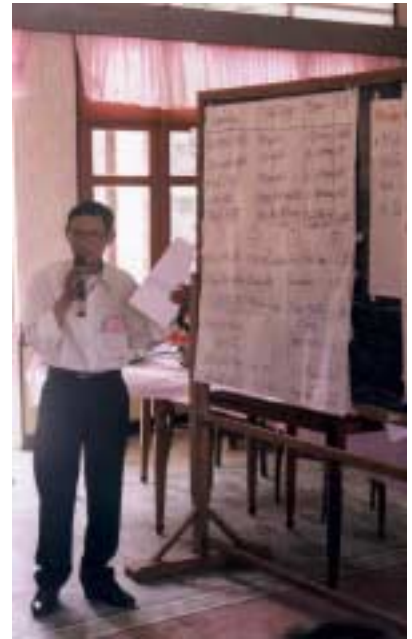
Président de la commune de Sùng Nhon expliquant le calcul des intérêts.

L'équipe mène bien le projet, et plus de 90% des décisions importantes sont prises par elle et par les autorités (sans intervention de Bernard). Le point un peu difficile reste la gestion des ressources humaines et les questions plus stratégiques. Des interviews par un expert extérieur, dans le cadre de l'évaluation, ont montré qu'il était dangereux et contre-productif de forcer l'allure pour la « vietnamisation » : l'équipe ne se sent pas toujours à l'aise quant'aux décisions stratégiques et de gestion interne. Une série de discussions sur le fond ont eu lieu, suite à une première partie du rapport d'évaluation, dont voici les conclusions :