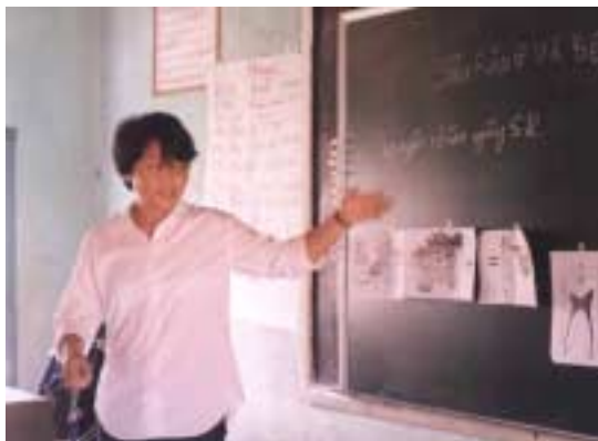
Hàng : formation des chefs de groupe

Ces tests sont désormais systématiques, et ces 2 tableaux ne sont que des exemples.